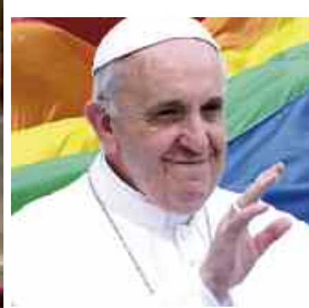
Francesco ha ripetutamente mostrato simpatia per gli omosessuali tanto da giungere al punto di beatificare un omosessuale incallito come Paolo VI.