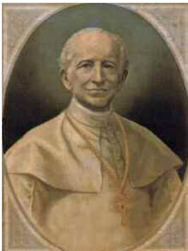
Papa Leone XIII.

I quali Collegi, se per lungo uso ed esperienza riuscirono di gran vantaggio ai nostri padri, torneranno molto più vantaggiosi all'età nostra, perché opportunissimi a fiaccare la potenza delle sette. I poveri operai, oltre ad essere per la stessa condizione loro degnissimi sopra tutti di carità e di sollievo, sono in modo particolare esposti alle seduzioni