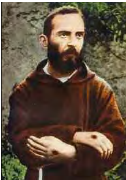
Padre Pio con le stigmate.

che rimase col fiato sospeso. Quello che il mondo non sapeva, però, era che non vi sarebbe potuto essere alcun missile russo a Cuba, in grado di colpire le città degli Stati Uniti, se gli stessi Stati Uniti non avessero trasferito all’Unione Sovietica una particolare tecnologia con cuscinetti a sfera, necessaria per costruire i sistemi di guida dei missili