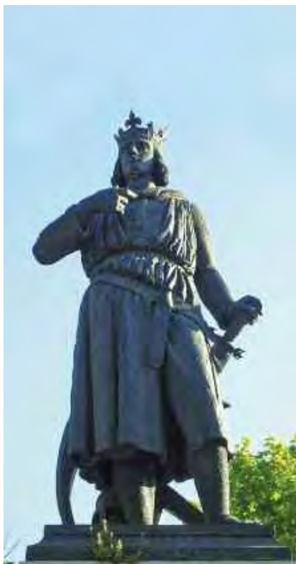
San Luigi IX di Francia.

Non dimentichiamo gli ordini satanici delle Logge, sotto il comando degli Illuminati di Baviera (fondati, nel 1776, da Adam Weishaupt, scelto per lo scopo da Amschel Mayer Rothschild) finalizzati a distruggere la S.R. Chiesa, la Chiesa Ortodossa, e tutte le monarchie cristiane; sponsorizzando (1848) il "Capitale" del massone israelita e satanista Karl Marx "La Religione è l'oppio dei popoli", attraverso ogni mezzo: dalla decapitazione di