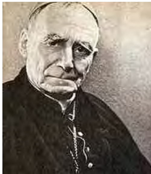
Card. José Maria Caro y Rodriguez , Primo Cardinale di Santiago, Cile (1939-1958).

6° – La Massoneria farà di tutto per affiliare membri dei vari partiti politici , per difendere i suoi ideali e per impegnarli a votare per essi: separazione tra Chiesa e Stato, espulsione delle Congregazioni religiose, registrazione civile, istruzione esclusivamente laica, ospedali serviti SOLO da infermiere laiche, soppressione della Cappellania militare e di altre leggi clericali .