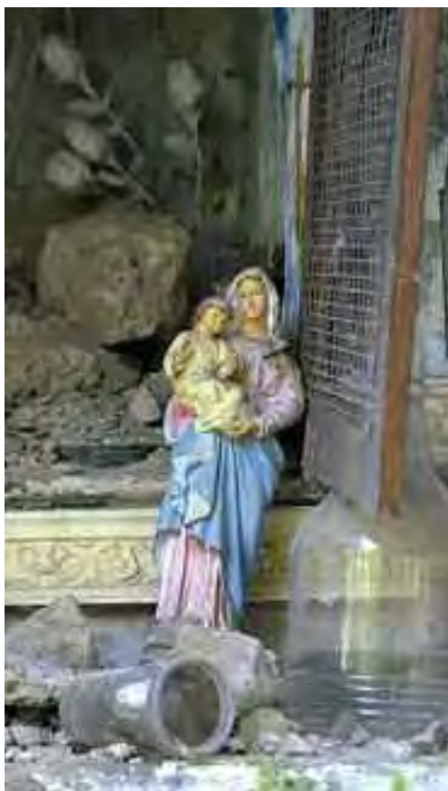
La statua intatta della Madonna col Bambino, tra le macerie di Pescara del Tronto.

Le sue ancelle hanno il permesso di frequentare le feste e i balli che spesso vengono organizzati nei villaggi che contornano i monti, per fare proseliti: le ragazze sono stupende ed i giovanotti perdono spesso la testa. Ma la prudenza