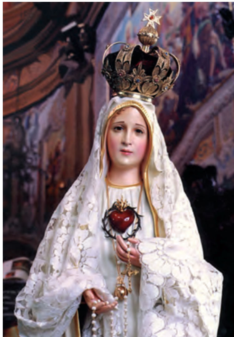
La Madonna di Fatima.