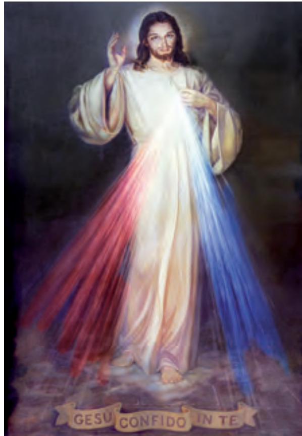
Immagine del Gesù Misericordioso.

Ora, nel “Diario” di Suor Faustina si apprende, invece, che siamo vicini al termine della Storia, perché imminente sarebbe la seconda ed ultima venuta di