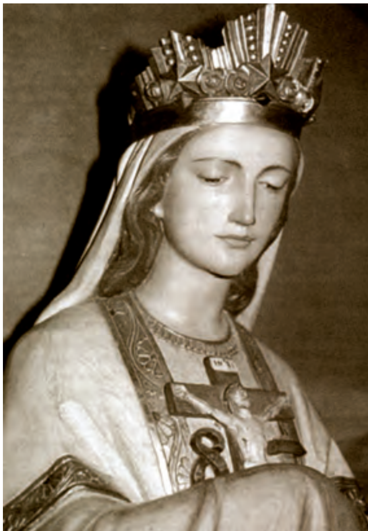
La Madonna de La Salette.