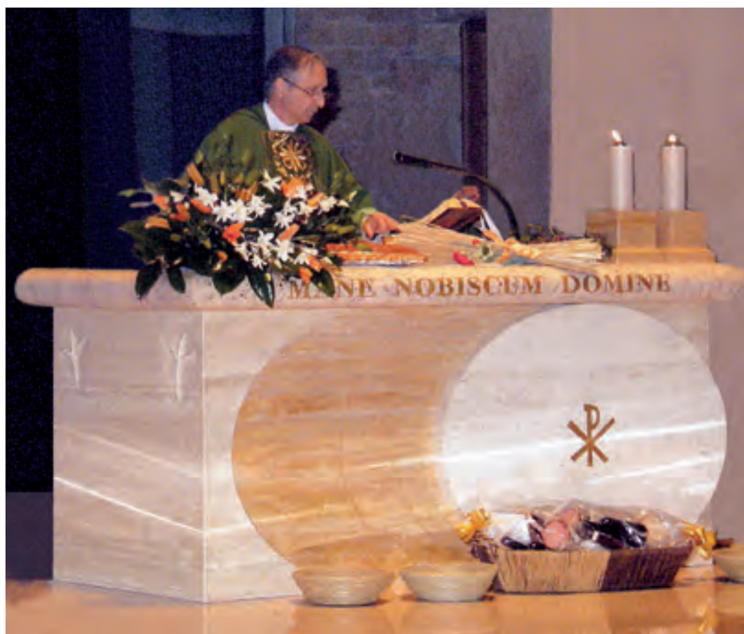
Mons. Luciano Monari, all'altare del Tempio satanico di Padergnone (Brescia).

Il giorno 8 settembre 2011, il settimanale diocesano “La Voce del Popolo”, il “Giornale di Brescia”, “Bresciaoggi” e “Avvenire”, pubblicavano un articolo sull'intervento del Vescovo di Brescia, mons. Luciano Monari, contro il plurinovantenne sacerdote don Luigi Villa. Mentre “La Voce del Popolo” riportava il testo completo dell'intervento; l’“Avvenire” si limitava ad un breve estratto; il “Giornale di Brescia”, citando il testo del Vescovo, usava il titolo: “Il Vescovo di Brescia: don Villa infanga la Chiesa”; il “Bresciaoggi”, riprendendo estratti dell'intervento, aggiungeva un breve commento sui templi satanici di San Giovanni Rotondo e di Padergnone (Rodengo Saiano). L'intervento, inoltre, è stato diffuso via Radio e Televisione locali. Ecco il testo integrale dell'intervento di mons. Monari contro don Luigi Villa, pubblicato su “La Voce del Popolo” (i grassetti sono nostri).