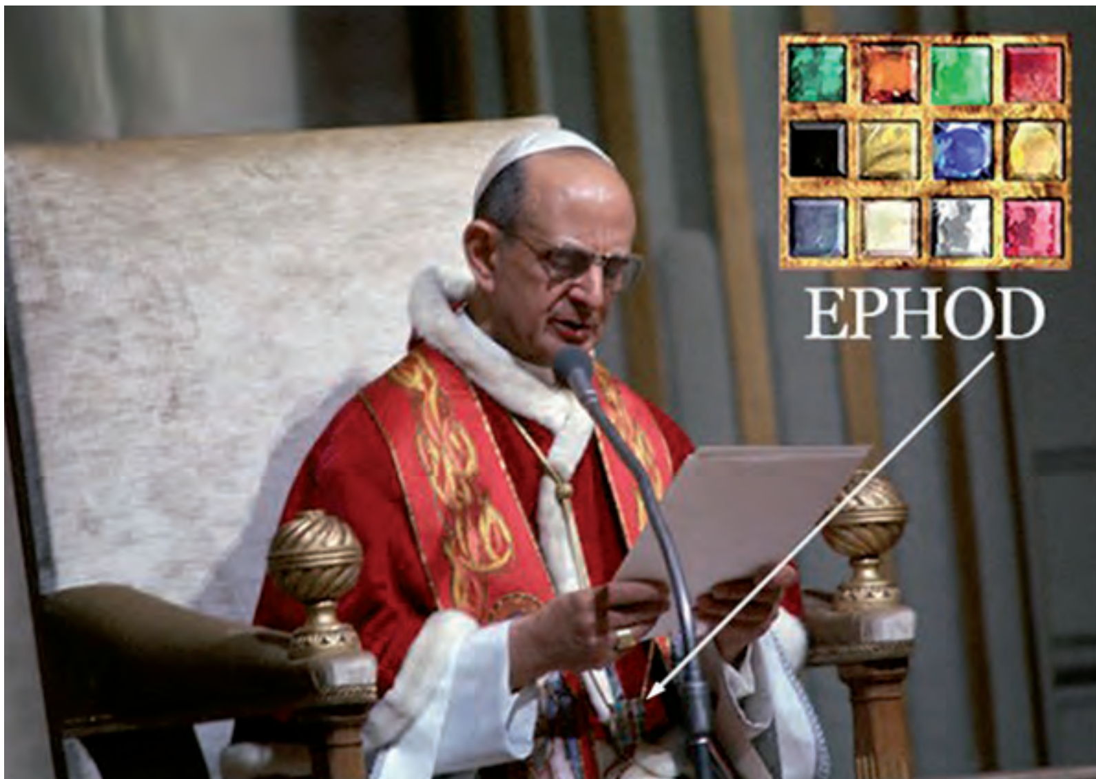
Una delle tante fotografie che ritraggono Paolo VI con l' Ephod sul petto. L'Ephod, che il Sommo sacerdote Caifa indossava quando condannò a morte Gesù Cristo perché si era dichiarato Figlio di Dio , è il più antico simbolo della negazione della divinità di Cristo .

Eccellenza, Lei, che è un biblista, certamente saprà che nelle Sacre Scritture sta scritto: «Maledetto l'uomo che confida nell'uomo e fa suo braccio la carne, e il cui cuore rifugge dal Signore»!