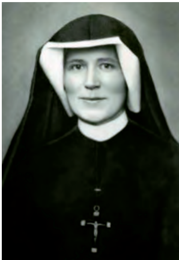
Suor Faustina Kowalska.

2°) essere demandata alla prudenza dei Vescovi il compito di rimuovere le predette immagini che eventualmente fossero già esposte al culto» (Sacra Congregazione del Sant'Uffizio, Notificazione del 6.3.1959).