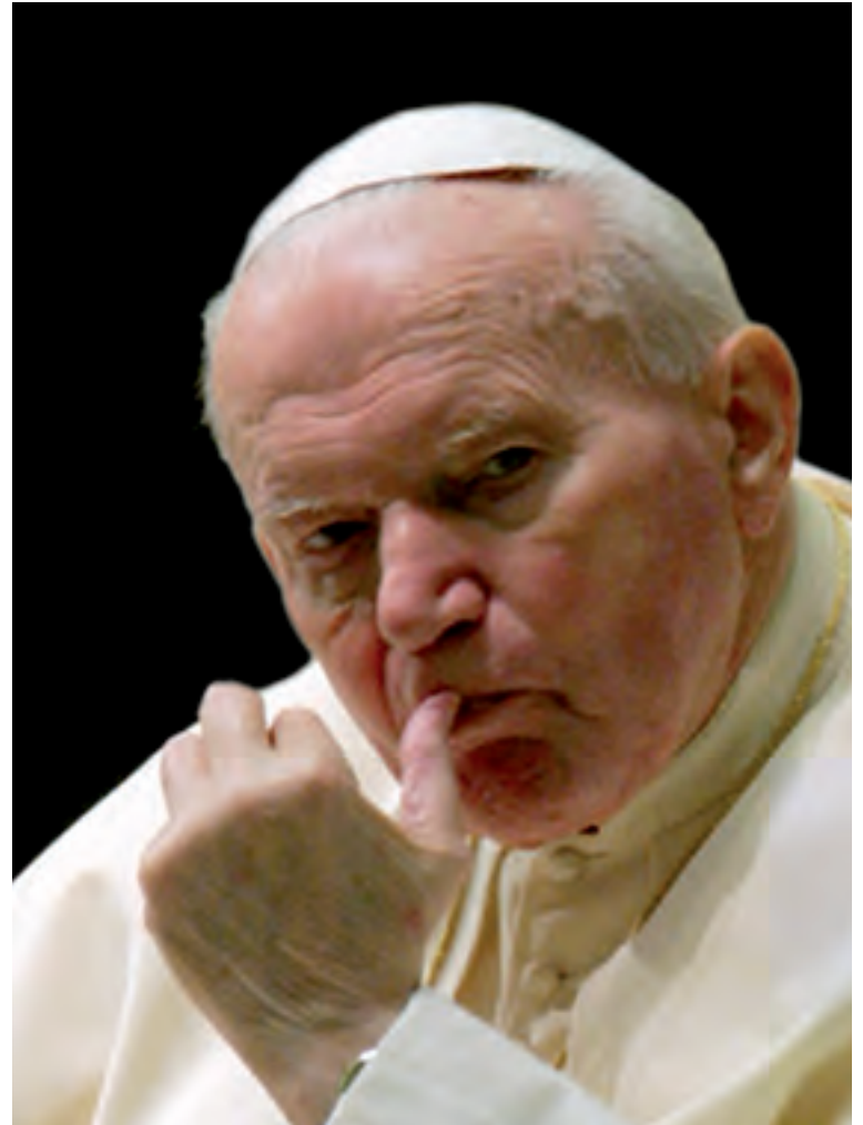
Giovanni Paolo II.

Quando Lei, Eccellenza, ha scritto che don Villa , nella sua “autonoma” di “grande inquisitore” è “difensore della fede” anche “contro Giovanni Paolo II” , certamente sapeva che “Chiesa viva” , nel settembre 2009, ha pubblicato un Numero Speciale anche su questo Papa, documentando i seri argomenti per la sua contrarietà alla Sua beatificazione. Per brevità, Le cito solo alcune frasi scritte o pronunciate dallo stesso Giovanni Paolo II , tratte da questa pubblicazione: