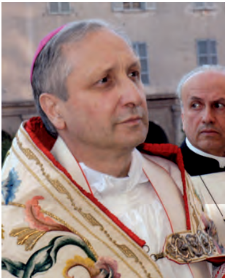
Mons. Luciano Monari, Vescovo di Brescia.

A l termine della lettura di questo intervento di Mons. Monari, si è colti da un senso di “vuoto”. L'intero intervento è un capolavoro nell'arte della diffamazione e nell'uso di ogni trucco ed espediente per gettare sul “diffamato” ogni sorta di calunnia e insinuazione, con l'accortezza di fornire una scusa, o una ragione implicita, per non doversi sobbarcare l'onere e le conseguenze di dover entrare nel merito degli argomenti sostenuti e documentati da don Luigi Villa, nei suoi scritti. Se si pensa che un giudizio serio ed onesto nasce da specifiche conoscenze e che la conoscenza deriva dai “fatti”, l'eliminazione dei “fatti” crea un “vuoto” che può essere, però, sapientemente colmato con frasi d'effetto; giudizi pesanti, per compensare la loro “leggerezza”; esternazioni emotive, per impressionare il lettore; dotte citazioni, con nessuna relazione col soggetto; pungenti ironie, per provocare ferite senza alcun rischio; dichiarazioni tanto “libere”, da essere fuori dal contesto. E tutto questo con lo scopo di lanciare sull'Autore degli scritti incriminati una tale mole di calunnie e insinuazioni, forse, per far desistere chiunque osasse azzardarsi a chiedere spiegazioni o a in-