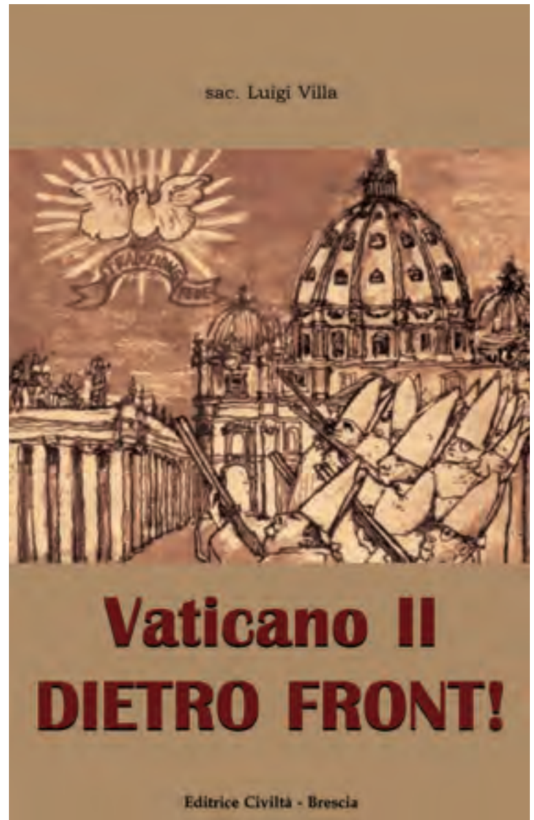
Copertina del libro: “Vaticano II, dietro front!” in cui don Luigi Villa dimostra le Eresie del Vaticano II.

Che “intelligenza” ci vuole per esprimere “con parole corrette” la frase: «Andate e predicate il Vangelo a tutte le genti (...) chi crederà sarà salvo e chi non crederà