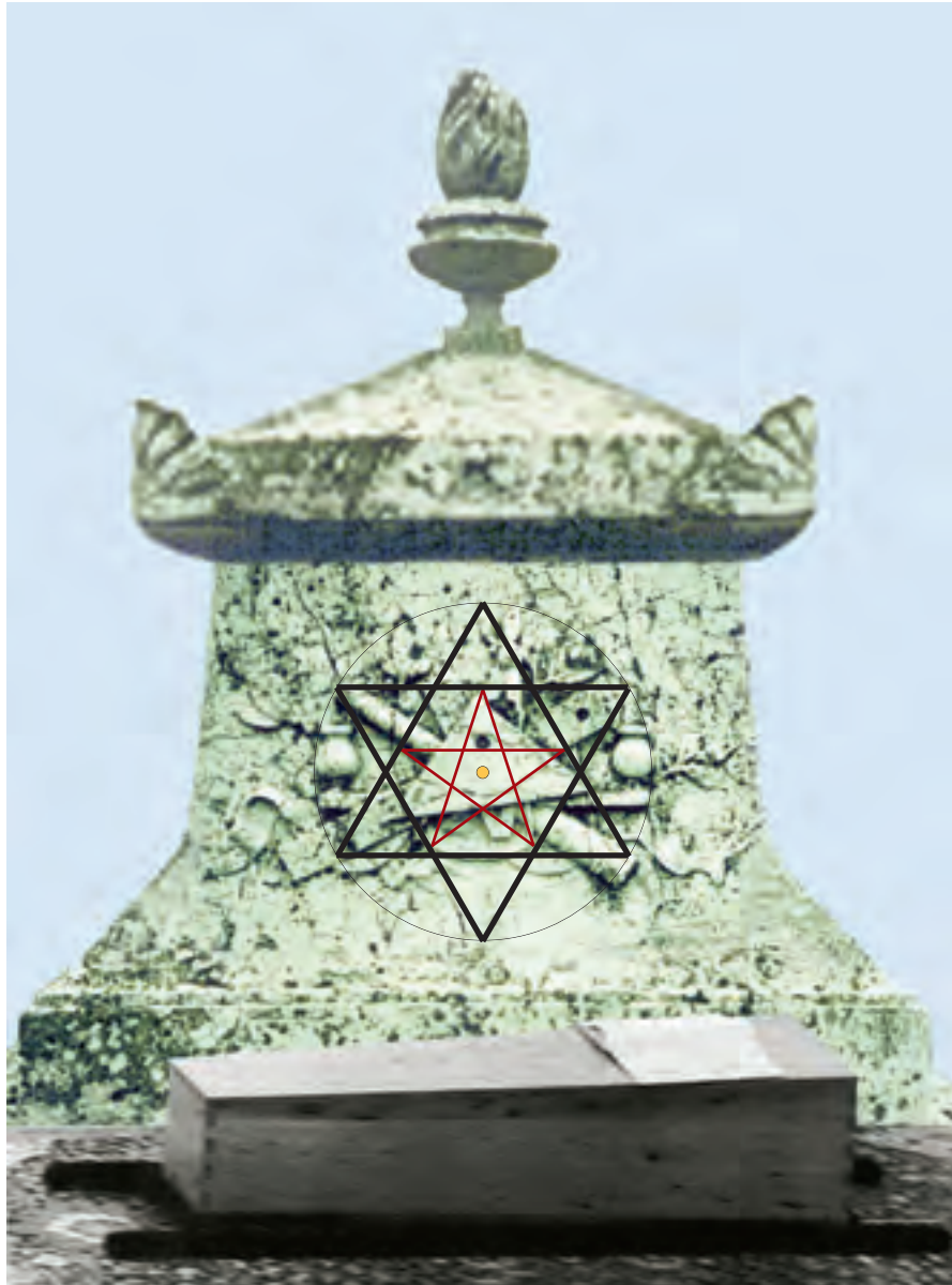
Il tombale della madre di Paolo VI, eretto nel 1943, sul quale Mons. Montini fece scolpire dei simboli massonici che, con precisione perfetta, definiscono la geometria della blasfemia e satanica Triplice Trinità massonica .

Ora, dopo quanto detto sulla figura di don Luigi Villa , in molti si possono domandare: «Ma chi è questo don Villa?» .. Certo, ognuno può definirlo e presentarlo come gli pare, ma anche per Noi di “Chiesa viva” non è facile riassumere in uno schema preciso questo personaggio, per i suoi molteplici ruoli di Sacerdote, scrittore e giornalista... anche se dobbiamo affermare che Egli è un prete sempre in prima fila nelle più importanti battaglie religiose e morali.