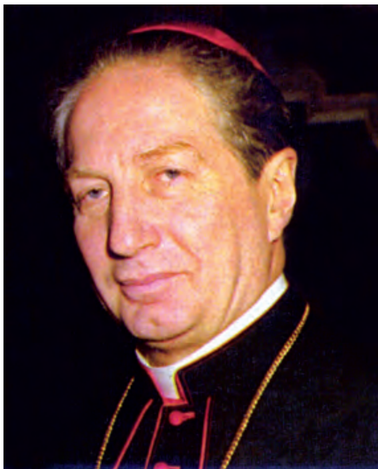
Il cardinale Carlo Maria Martini.