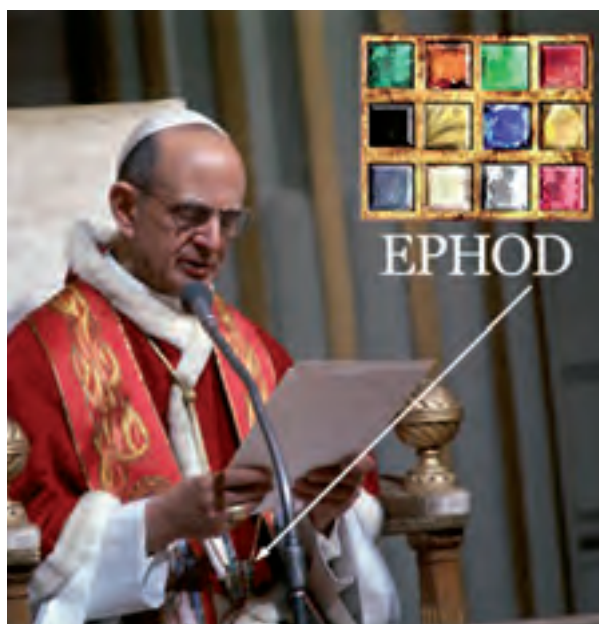
L’Ephod, che Paolo VI portò per anni sul petto, era forse l’emblema di una “nuova condanna a morte” del Figlio di Dio, tramite la negazione della divinità di Gesù Cristo?

Basta, a questo proposito, rileggere il “ Credo ” (la principale preghiera cattolica creata dal dogmatico Concilio Tridentino con la bolla di Pio V nel 1564) ed accorgersi che alle parole perentorie e indiscutibili... “ il terzo giorno resuscitò da morte... ”, nella stessa preghiera, uscita dal Concilio Vaticano II , a quelle parole si sono incredibilmente aggiunte le parole.... “ secondo le scritture ”, senza alcun motivo se non quello di evidenziare che si può credere alla Resurrezione di Gesù (il fondamento del Cristianesimo cattolico) solo perché scritto così nei Vangeli, ma, con ciò, inducendo nella sua sostanza al dubbio sulla realtà di quell’Avvenimento , contrariamente ai precedenti Avvenimenti, per i quali non è prevista quella apposizione. Ed in verità già questa blasfema ipotesi , a ben guardare, potrebbe costituire una tappa importante nel cammino verso il traguardo finale di considerare tutte le religioni uguali tra loro e stabilire nel mondo un sincretismo totale.