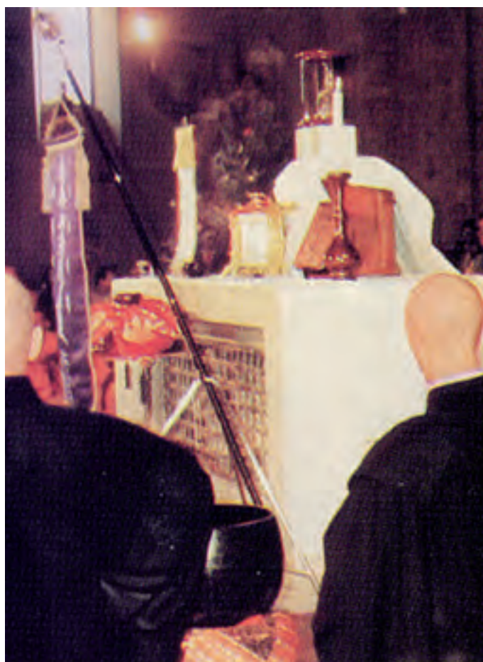
Assisi 1986. Per "non offendere" i rappresentanti delle false religioni convenuti ad Assisi per la preghiera per la pace, Giovanni Paolo II impedì l'ingresso nella Basilica alla statua della Madonna di Fatima, ma permise di far porre sull'altare, una statua di Budda... proprio sopra il Tabernacolo che conteneva Nostro Signore Gesù Cristo!

La Fede dev'essere confessata a tutti i costi e il dovere di confessarla è ancora più grave quando sono le autorità stesse della Chiesa che si trovano all'origine di questi terribili scandali.