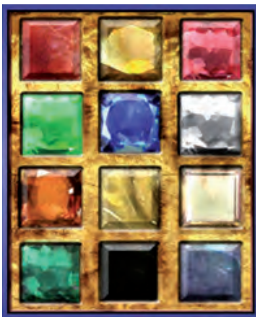
L'Ephod, il monile del Sommo Sacerdote del Gran Sinedrio, che Caiifa indossava quando condannò a morte Gesù Cristo per essersi dichiarato "Figlio di Dio"!

Riassumendo quindi: la prevalenza economico-finanziaria, che il mondo attuale subisce, e subirà ancor più nel futuro, non è che il primo gradino di una scalata che mira ben più in alto, e cioè ad un Governo Mondiale e ad una "Controcchia" universale. Invito chi di voi avesse la curiosità intellettuale di indagare su questi temi a leggere un'opera veramente documentata e ragionata, qual è "Il Governo Mondiale la Contro-