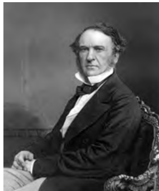
Lord Palmerston, politico inglese e più volte Primo Ministro, fu il Capo supremo dell’Ordine degli Illuminati di Baviera dal 1836 al 1865.

Se il “partito d’azione” dovesse perdere, i membri del “partito intellettuale”, che chiude le sue Logge durante la fase cruenta dell’insurrezione o della rivoluzione, subito dopo, appaiono, se possibile, come partigiani e sostenitori dei partiti emergenti o vincenti, o, se ciò non è possibile, essi congiurano nell’ombra. Essi fanno di tutto per mettere dei “fratelli” in posti di potere, essi promuovono manifestazioni, agitazioni ma, in ogni caso, essi vengono in aiuto ai “fratelli” membri del “partito d’azione” . Essi attenuano le colpe, condannando la sbadata impetuosità e avventatezza della mal consigliata e troppo ardente, anche se buona, natura degli uomini coinvolti. Essi implorano per essi la comprensione e la pietà, promuovono la compassione popolare e, appena possibile, essi fanno liberare i colpevoli, per preparare nuove sommosse e insurrezioni.