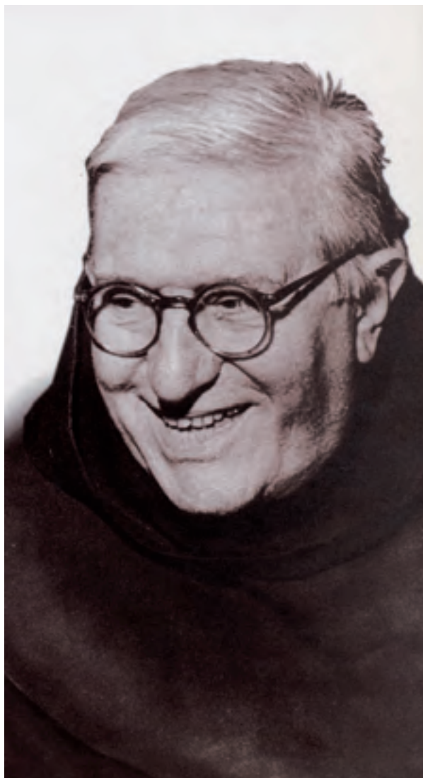
Padre Gemelli è stato il filosofo della prima persecuzione contro Padre Pio.

Ma questo “rimangiamento”, pur rivelandosi efficace, almeno per molti anni, è tacito, nel senso che non si ritiene opportuno comunicarlo ufficialmente con una “declaratio”, un “monitum” e un “decretum”.