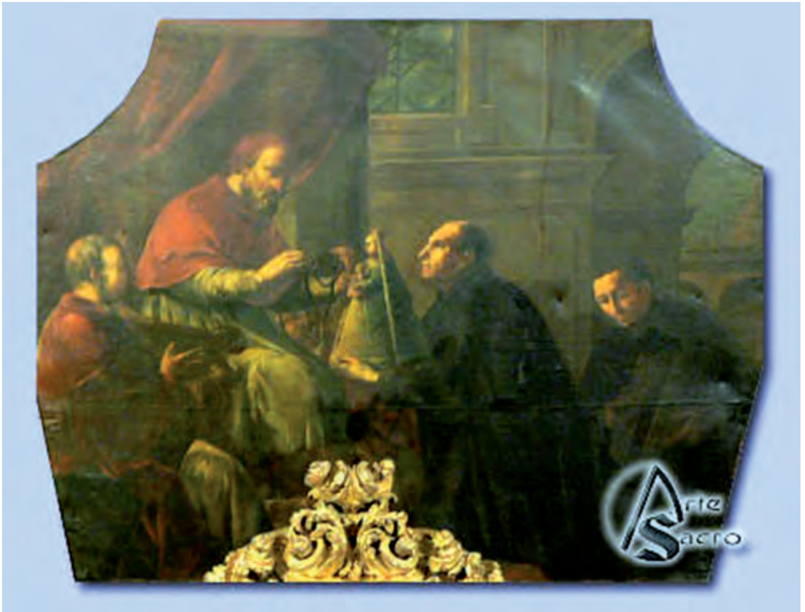
Dipinto che ritrae i due Fratelli Gabriel de Fontanet e Guillermo de Rigosa che mostrano a Papa Paolo V la Statua miracolosamente trovata in una cava in Spagna. Paolo V , ritratto nel gesto di togliersi il pettorale per metterlo al collo della sacra Statua, dopo essersi inginocchiato davanti a Lei, l'abbracciò e La baciò, Le diede il nome di Nostra Signora del Buon Successo e ordinò di promuovere la sua devozione.