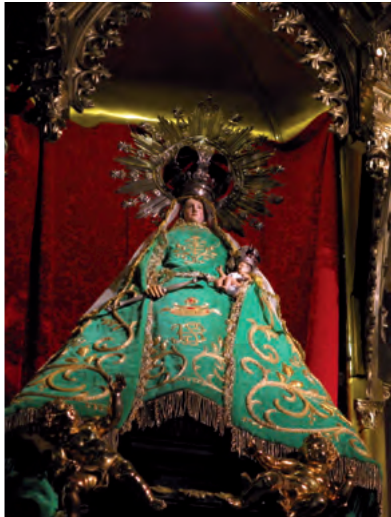
La sacra Statua di Nostra Signora del Buon Successo, trovata dai due Fratelli "Obregones" in una cava presso Traiguera, ed attualmente situata nella Chiesa del Buon Successo di Madrid.

Poi, Papa Paolo V benedì la statua, le concedette molte indulgenze, le diede il nome di "Nostra Signora del Buon Successo" e comandò che la sua devozione fosse subito promossa; inoltre, in memoria della croce che aveva posto su di essa, autorizzò i Frati dell'Ordine che stava per approvare, di usare una croce di panno su una tunica nera.