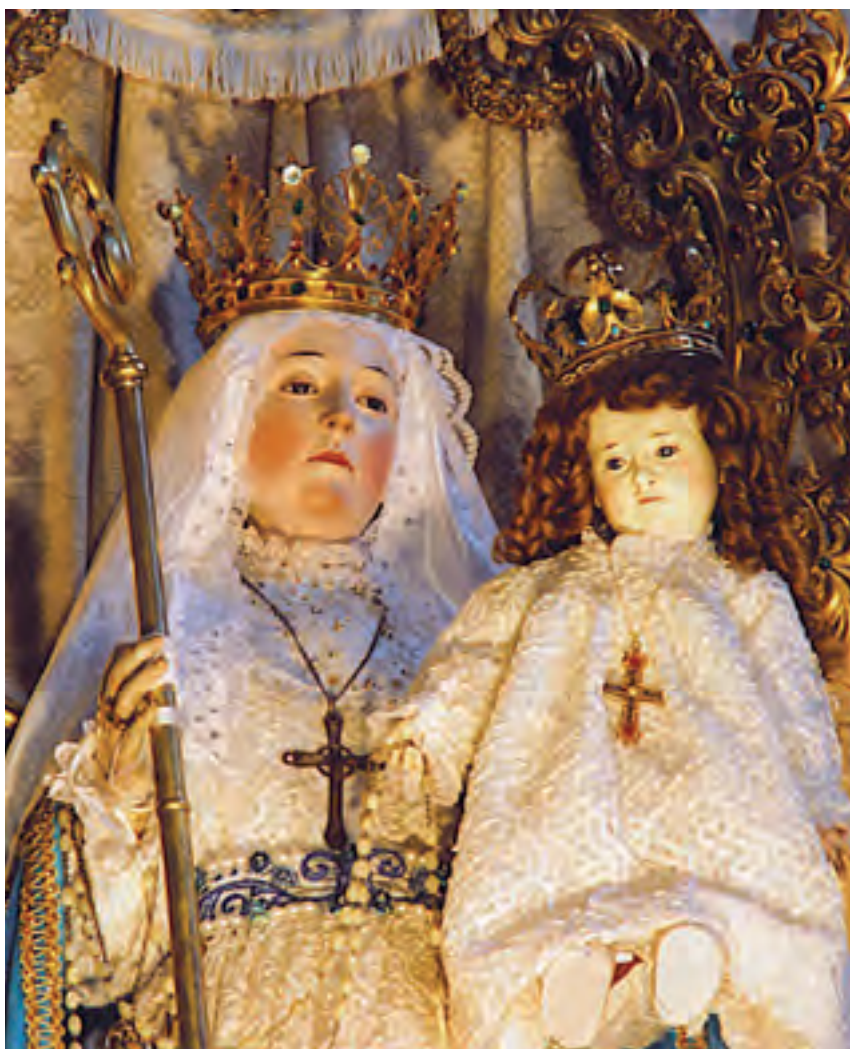
Nostra Signora del Buon Successo col Bambin Gesù sul suo braccio sinistro e col Pastorale nella mano destra, simbolo del potere di governo sul Convento dell'Immacolata Concezione di Quito.