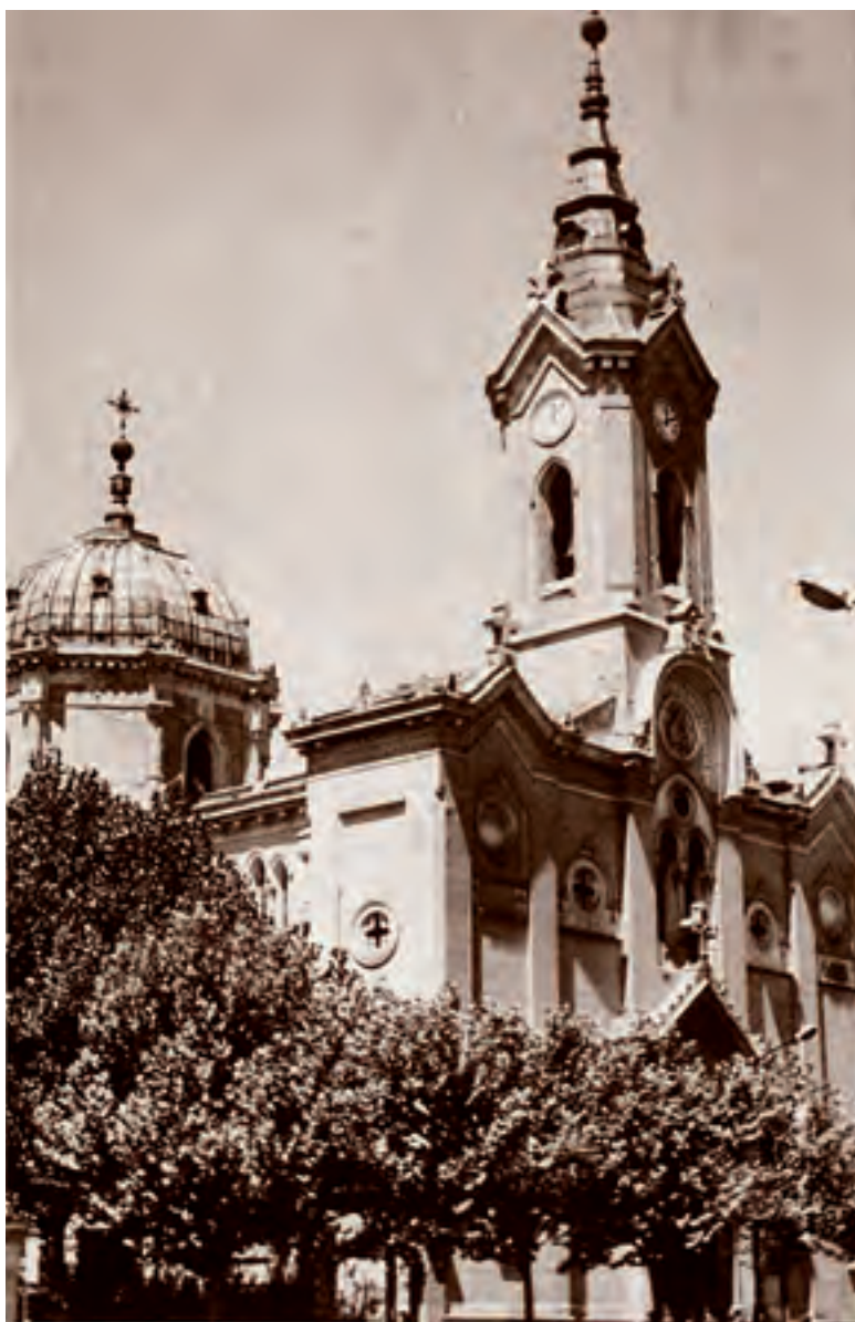
Una vista della Chiesa del Buon Successo, voluta dalla Regina Isabella II di Spagna, ed eretta a Madrid, nel 1868, in Via de la Princesa, di fronte all'Hospital Central del Aire.

Infine, Paolo V decretò che la " Congregazione religiosa dei Minimi per l'assistenza ai malati " fosse eretta ad Ordine Religioso .