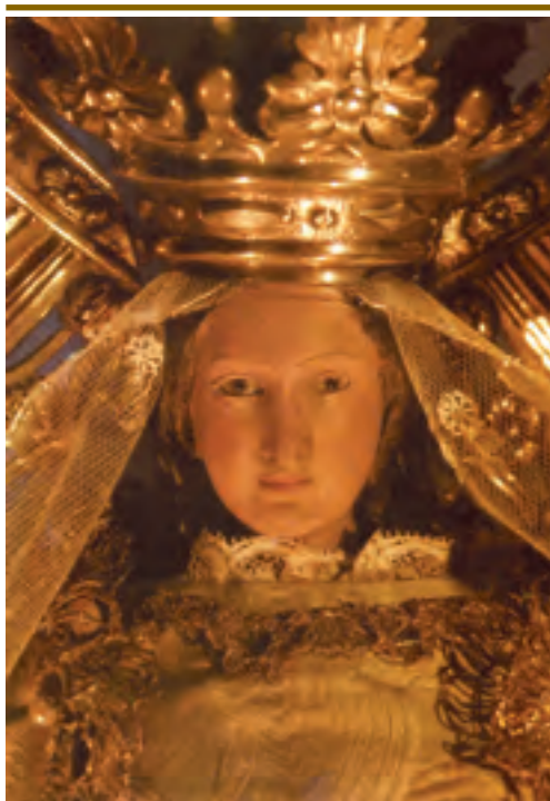
Volto della sacra Statua di Nostra Signora del Buon Successo posta sopra l'altare maggiore nella chiesa a Lei dedicata, a Madrid.

All'età di sette anni, un incendio distrusse la chiesa danneggiando anche la casa e la proprietà paterna, precipitando nella miseria l'intera famiglia che si dovette trasferire, con i tre figli, nella cittadina di Santiago di Galizia, nella parte nord occidentale della Spagna.