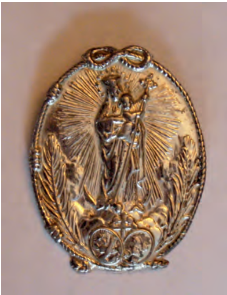
Il Medaglione fatto coniare da Madre Maria , per ricordare la scena, descritta da Mariana, della Madonna col Bambin Gesù che schiacciano il dragone infernale dalle sette teste che voleva annientare la nave con le Fondatrici del Convento di Quito. Da allora, tutte le Suore del Convento dell'Immacolata Concezione di Quito lo indossano.

Su richiesta delle famiglie più influenti e di gran parte della popolazione della città di Quito, il Re di Spagna, Filippo II , nel 1566, emise un decreto per la fondazione del Convento Reale dell'Immacolata Concezione , che fu poi eretto in un angolo della piazza principale di Quito. Lo scopo del Convento era la preghiera dell'Ufficio Divino e l'educazione e la formazione religiosa delle figlie delle famiglie spagnole e creole della Colonia spagnola di cui Quito era la capitale. Il Re mandò dalla Spagna il primo gruppo delle Madri Fondatrici del Convento a capo delle quali pose Madre Maria de Jesus Taboada , una sua parente ed anche zia di Mariana Francisca de Jesus Torres .