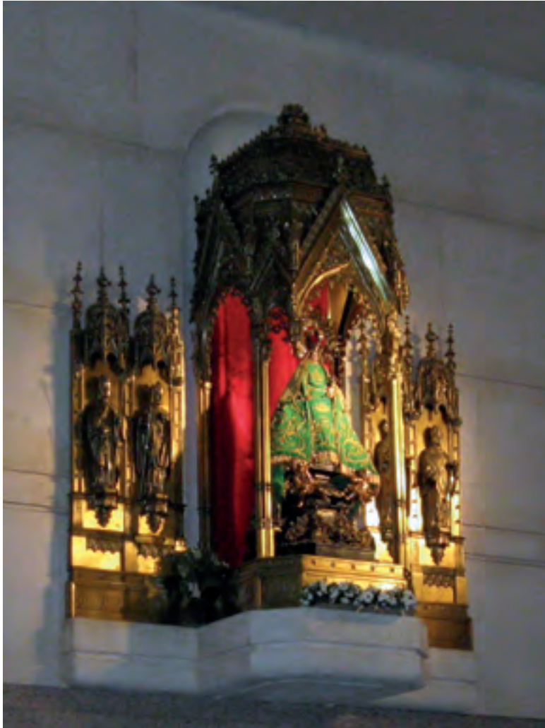
Veduta della sacra Statua di Nostra Signora del Buon Successo, collocata sopra l'altar maggiore della Chiesa del Buon Successo presso l'Hospital Central del Aire (l'Ospedale Militare) di Madrid.

monia la sacra Statua , che aveva dato il suo nome all'Ospedale di Corte ed alla sua chiesa, fu posta sull'altar maggiore.