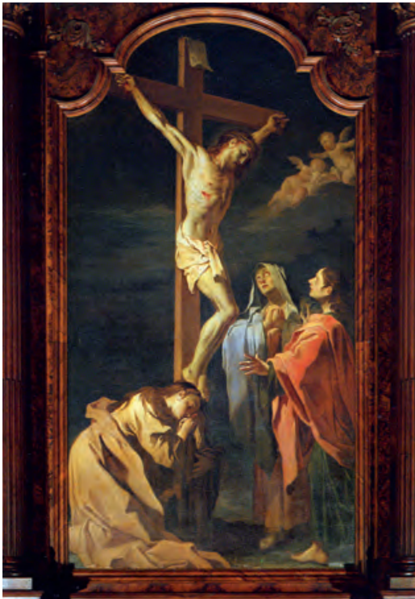
Gesù morente con Maria, Giovanni e Maddalena ai piedi della Croce.

«Fate ricorso a Lei in tutte le vostre necessità spirituali e temporali. Quando la vostra anima soffre per le tentazioni ed è immersa nel dolore e, se per divina permissione, la stella della vostra vocazione sarà nascosta alla vista della vostra anima, rivolgetevi a Lei, con confidenza, con queste parole: